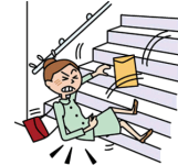
足を滑らせてケガ