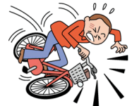
自転車で転倒してケガ※