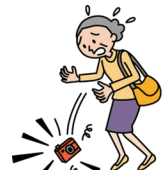
カメラを落として壊した