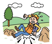
ハイキング中にケガ